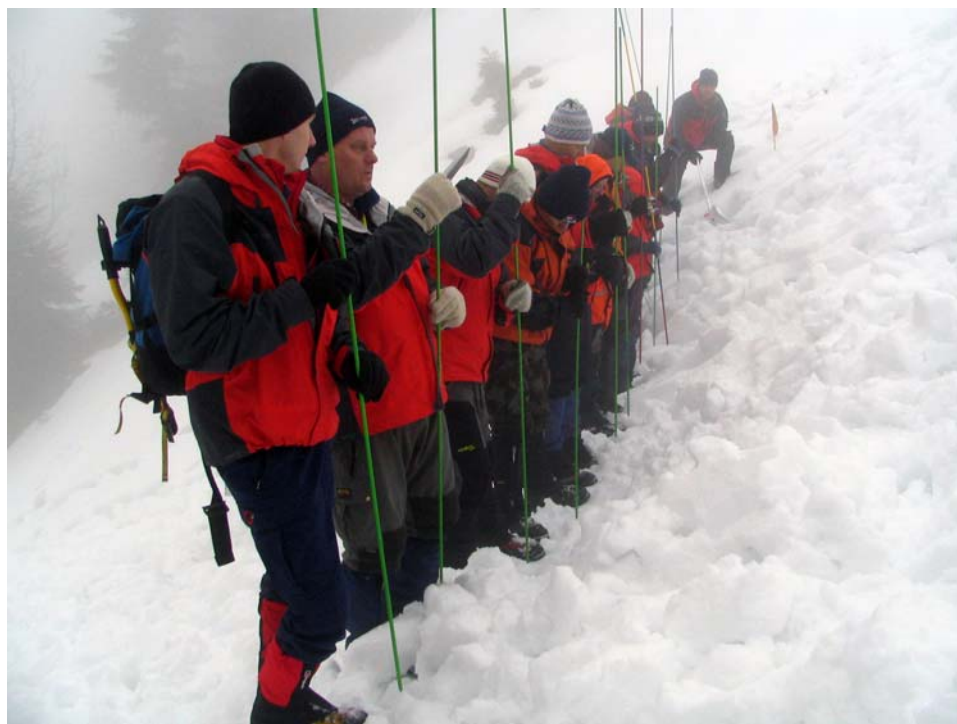
Kratke, z navojnim vretenom sestavljive lavinske sonde.

Kdaj so prvič prišli na idejo, da bi s prebadanjem plazovine iskali zasute niti ni tako važno. Precej dolgo je tega ko sta bili na tržišču dve vrsti sond. Bilgerjeva, ki je ostala še iz prve svetovne vojne, elementi so se sestavili s pomočjo vijakov, pretežno so jo uporabljali v nemško govorečih državah (Avstrija, Nemčija) in Lindenmannova lavinska sonda, ki smo jo po vzoru Švicarjev uporabljali tudi Slovenci.