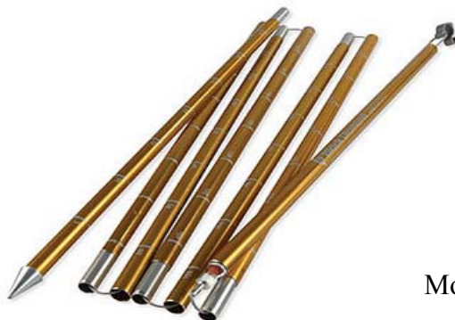
Moderna, aluminijasta sonda.

Sonde naslednje generacije so predvsem lažje in krajše, konica pa je topo zaobljena. Zobci niso več potrebni, ker so današnja oblačila iz umetnih, gladkih vlaken. Uporaba je že davno prerasla okvire reševalnih služb. Dokazano je, da čas od začetka iskanja z lavinsko žolno pa do izkopa občutno zmanjšamo, če v zadnji fazi določanja mesta zasutega uporabimo sonde. Hitri pregled in grobo sondiranje kritičnih mest na plazovini ne zahtevata lavinske sonde dolžine štiri metre, zato so sonde namenjene gornikom in turnim smučarjem dolge od 240 do 320cm. V glavnem so iz aluminija ali karbona.